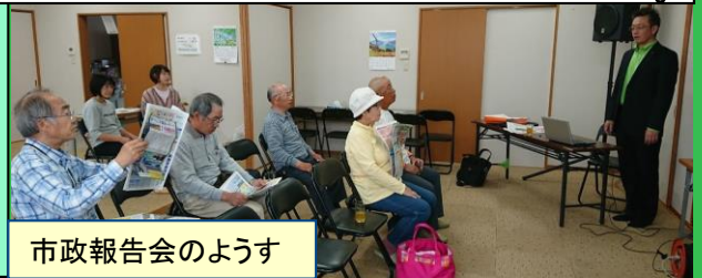
市政報告会のようす