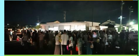
9月、水の配布には黒山の人だかり