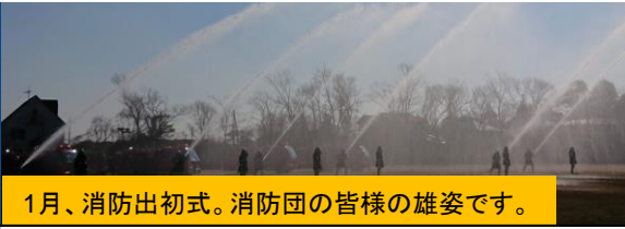
1月、消防出初式。消防団の皆様の雄姿です。