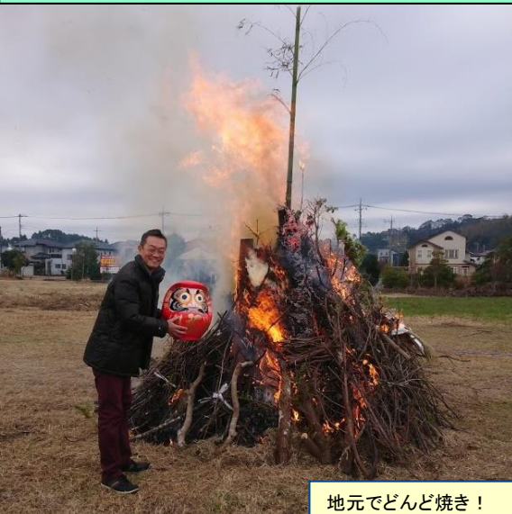
地元でどんど焼き！

担当委員会は文教福祉常任委員会。主に学校教育、保育はじめ子育て支援、さらに福祉行政について担当いたします。