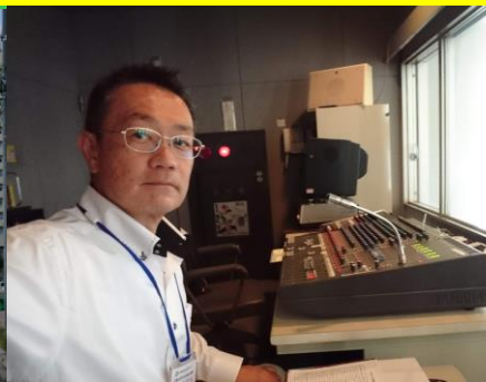
社協大網支部理事として「敬老の集い」お手伝い。