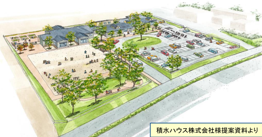
積水ハウス株式会社様提案資料より