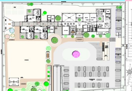
(仮称)子育て交流センター、積水ハウス株式会社様提案書より