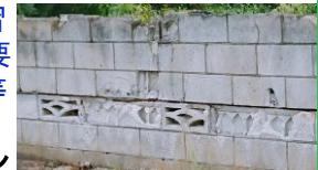
市内、通学路付近のブロック塀

※その他、(仮称)子育て交流センター整備事業について、小学生のICT教育(2020年からのプログラミング教育の導入)、公立学校エアコン整備の状況、市職員の労働環境改善について問いました。