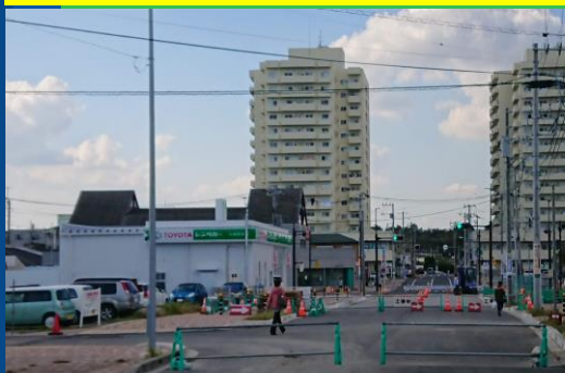
大網駅～イオン間の道路は11/9(金)開通予定。

大網小学校の隣、みどりが丘市有地の一部を活用して「(仮称)子育て交流センター」造成が決定。◎児童館◎学童保育◎放課後子ども教室◎地域子育て支援センター◎交流スペース、の機能を有します。同時に駐車場、交流広場も造成予定。12月より工事が始まり2019年12月に建物が完成、2020年4月から供用予定です。詳細な資料はみどりが丘自治会館にご覧いただけます。自治会の皆様には回覧済みです。尚、市では11月18日(日)13:30より、みどりが丘自治会館にて工事説明会を予定します。