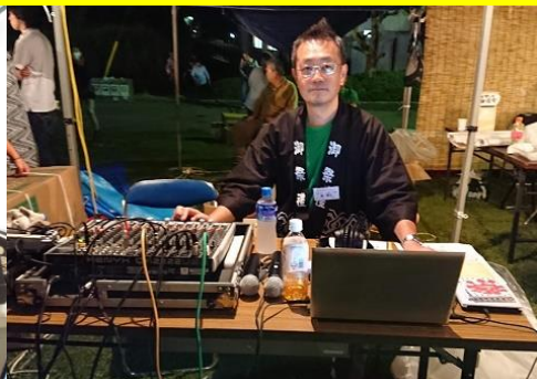
みどりが丘の「きららまつり」今年も無事終了。