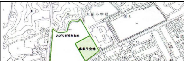
11/3市政報告会で、資料を基に、この事業の説明を致します。

☆「第12回市政報告会」を開催します。 日時:平成30年11月3日(土)、午前10:00～ 場所:みどりが丘自治会館 ※どなたでもご参加いただけます。