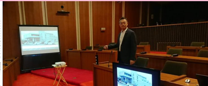
今会期から、一般質問時にプロジェクターを本市議場で初めて導入しました。